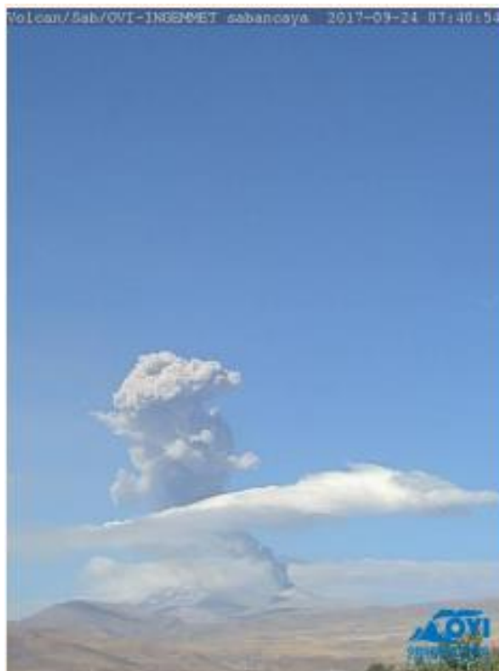
Emisión de ceniza y gases (24 de septiembre de 2017)

En general, el informe emitido por el Comité Técnico-Científico para la Gestión del Riesgo Volcánico en la región Arequipa, conformado por el Observatorio Vulcanológico del Sur del IGP y el Observatorio Vulcanológico del INGEMMET, señala que la actividad eruptiva ha incrementado ligeramente y que este tipo de comportamiento puede continuar durante los próximos días.